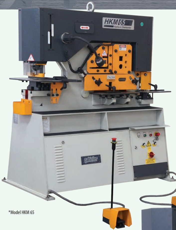
*Model HKM 65

Hidrolik Kombine Makas – Çift Pistonlu Model / Hydraulic Steelworker – Double Piston ГИДРАВЛИЧЕСКИЕ ПРЕСС-НОЖНИЦЫ – ДВА РАБОЧИХ ПОРШНЯ