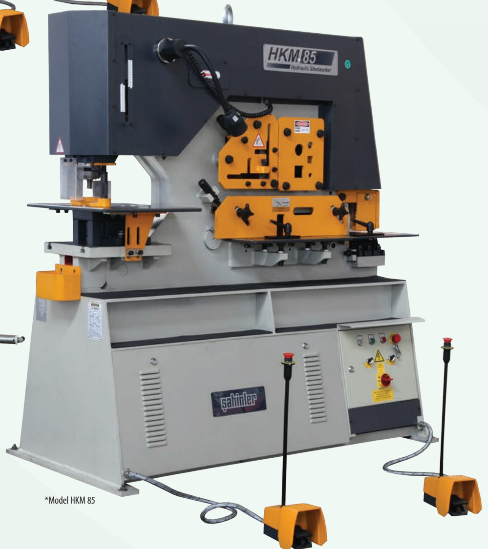
*Model HKM 85