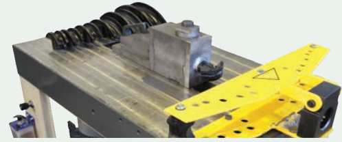
Opsiyonel boru bükme kalıpları Optional pipe bending tools ДОПОЛНИТЕЛЬНЫЙ ИНСТРУМЕНТ ДЛЯ ГИБКИ ТРУБ